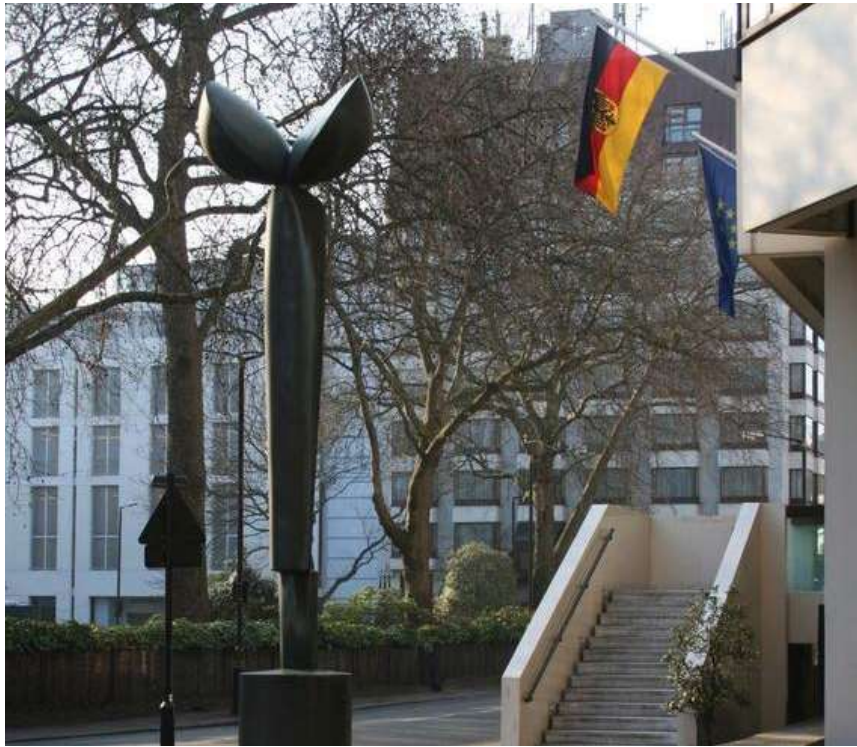
▲ „Große Flora L“ (1977/1978) von Fritz Koenig vor dem Eingang des Kanzleigebäudes der Deutschen Botschaft in London